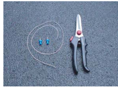
針がね、がびょう、万能バサミ