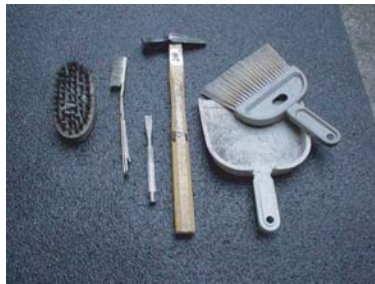
ワイヤーブラシ、金槌、たがね、ほうき、ちりとり