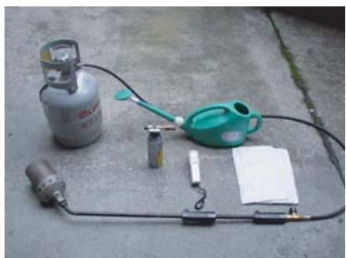
ガスバーナー、温度計、ジョウロ、水、ぞうきん

※温度計は貼り付け面の表面温度が測定できるものをご使用ください。(赤外線温度計など)