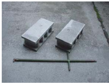
ブロック、専用バール